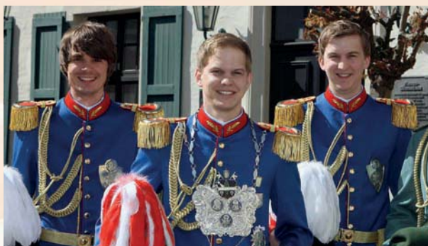
St. Katharina Junggesellen Bruderschaft 1708 e.V.