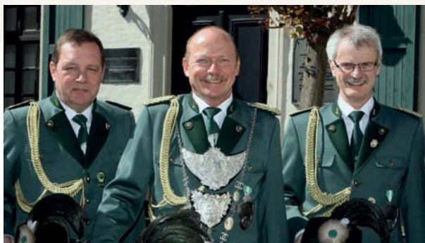
St.-Sebastianus-Bruderschaft 1504 e.V.